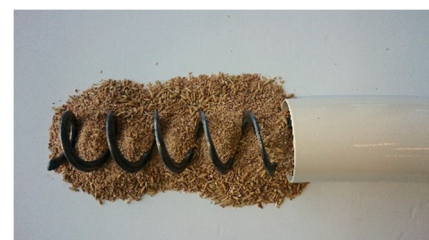
Slitande material, Flex90 stålrör/böj