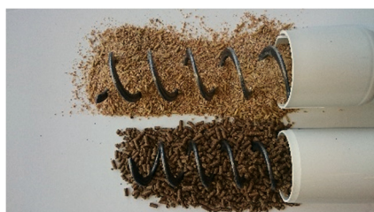
Spannmålskross, Flex90 Pelleterat foder, Flex90/75